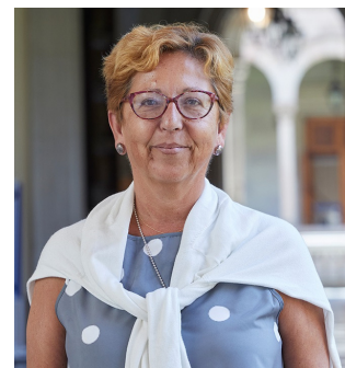
Olga Lanau, directora general del CSUC.

Espero que aquest petit document us sigui útil per valorar el camí que estem fent i, també, com no podia ser d'altra manera, per poder suggerir i fer les propostes de millora que considereu adequades.